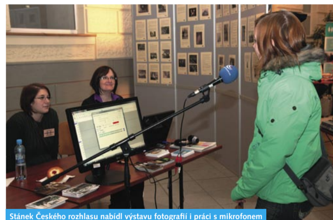
Stánek Českého rozhlasu nabídl výstavu fotografií i práci s mikrofonem