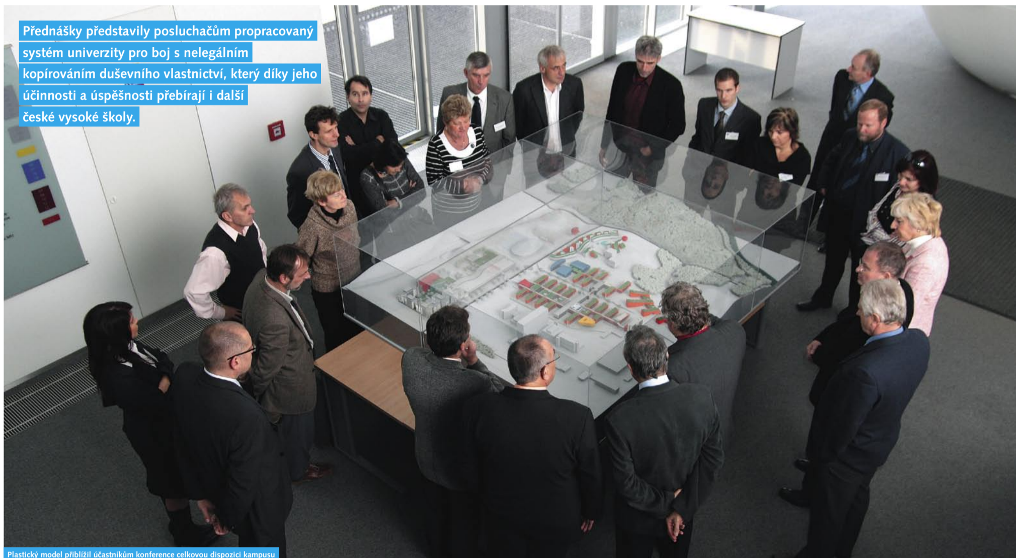
Plastický model přiblížil účastníkům konference celkovou dispozici kampusu

Přednášky představily posluchačům propracovaný systém univerzity pro boj s nelegálním kopírováním duševního vlastnictví, který díky jeho účinnosti a úspěšnosti přebírají i další české vysoké školy.