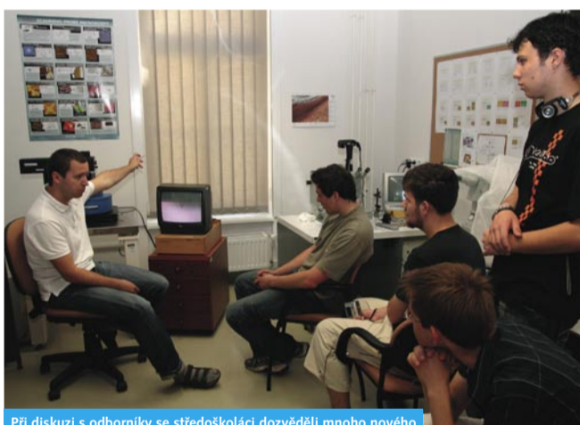
Při diskuzi s odborníky se středoškolačky dozvěděly mnoho nového