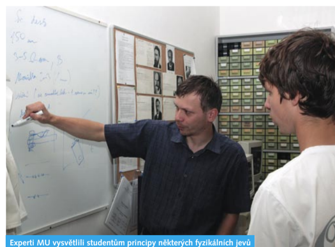
Expert MU vysvětlil studentům principy některých fyzikálních jevů