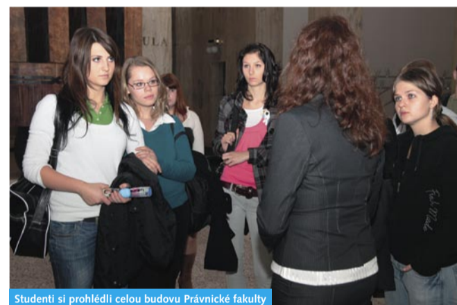
Studenti si prohlédli celou budovu Právnické fakulty