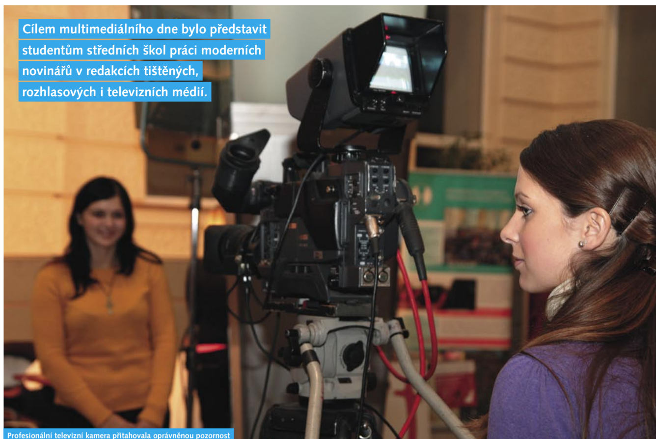
Profesionální televizní kamera přitahovala oprávněnou pozornost

Cílem multimediálního dne bylo představit studentům středních škol práci moderních novinářů v redakcích tištěných, rozhlasových i televizních médií.