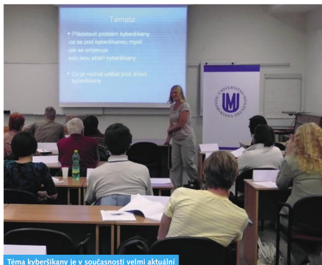
Téma kyberšikany je v současnosti velmi aktuální

Seminář pro výchovné poradce patří k akcím, které jsou součástí projektu Partnerství ve vzdělávání od jeho počátku a které se těší velké oblibě. Organizátoři každoročně vybírají aktuální témata, s nimiž se výchovní poradci i další pedagogové při své práci často setkávají. Pro seminář uspořádaný 30. září 2009 byla zvolena hned dvě: kyberšikana a práce s talentovanými dětmi. Do Univerzitního centra Šlapanice tentokrát dorazily více než dvě desítky účastníků.