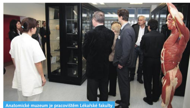
Anatomické muzeum je pracovištěm Lékařské fakulty