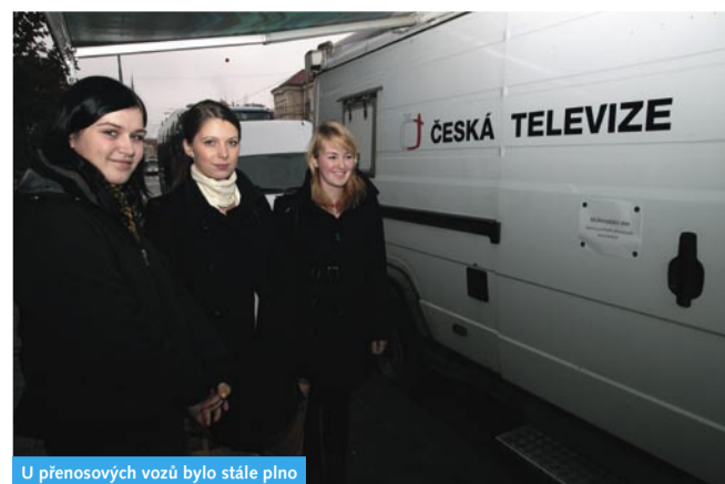
U přenosových vozů bylo stále plno