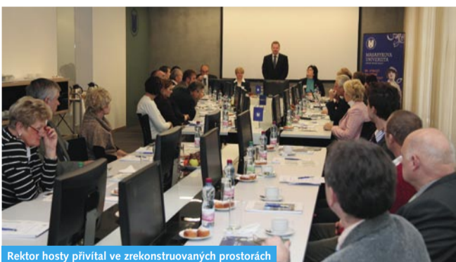
Rektor hosty přivítal ve zrekonstruovaných prostorách