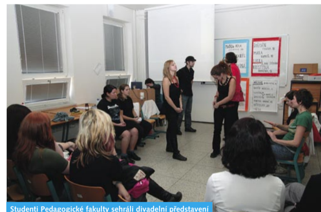
Studenti Pedagogické fakulty se hráli divadelní představení