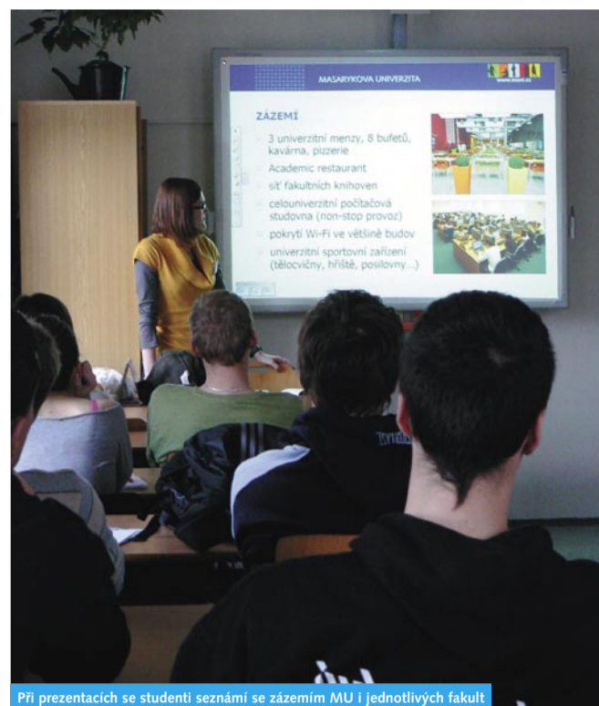
Při prezentacích se studenti seznámí se zázemím MU i jednotlivých fakult

Oproti předchozím letům se prezentace zatraktivnila, obsahuje více zajímavých obrázků a je stručnější a srozumitelnější.