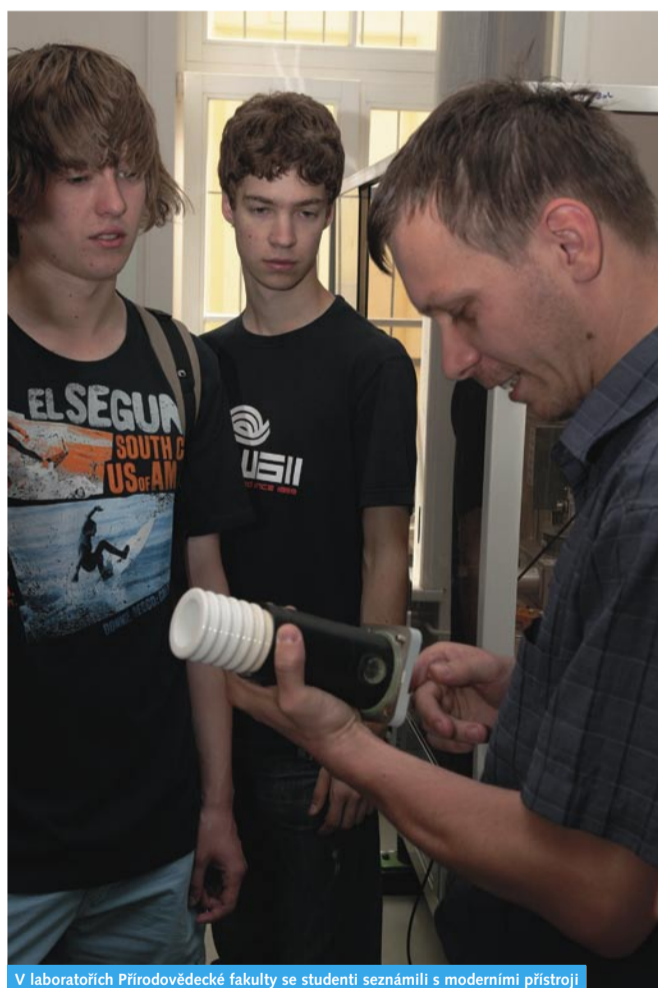
V laboratořích Přírodovědecké fakulty se studenti seznámili s moderními přístroji

Pilotní ročník Multimediálního dne prokázal, že mladí lidé se o média zajímají a chtějí se o nich dozvědět více. Studenti partnerských středních škol se mohou na tuto akci těšit také v roce 2010.