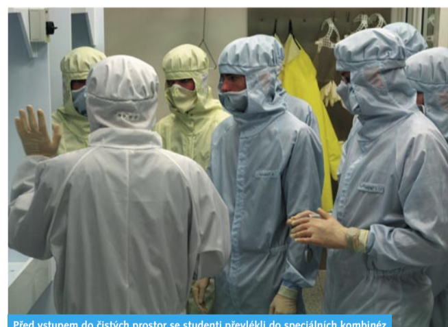
Před vstupem do čistých prostor se studenti převlékli do speciálních kombinéz