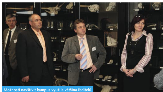
Možnosti navštívit kampus využila většina ředitelů