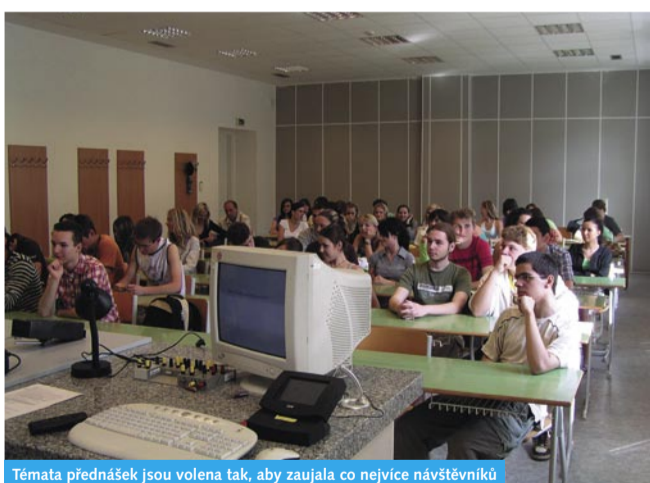
Témata přednášek jsou volena tak, aby zaujala co nejvíce návštěvníků